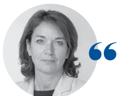
Valérie QUEMENER Présidente du tribunal administratif de Pau

Le contexte sanitaire qui a marqué l'année 2020 a entraîné une diminution du nombre des affaires enregistrées à 2 616, soit une baisse moyenne de 11,1 % par rapport à 2019, influencée par la chute de 35,2 % du contentieux des étrangers. À l'inverse, les affaires concernant l'urbanisme et l'environnement ont augmenté de plus de 20 %. Le tribunal confirme ainsi, en 2020, son caractère généraliste.